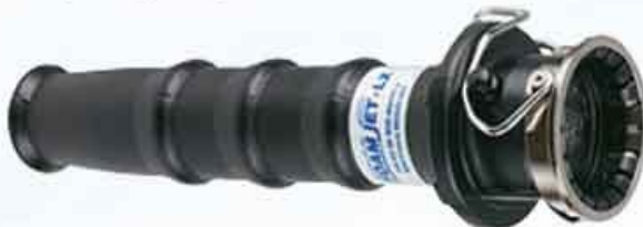
Model FJ-LX-HM Low-Expansion Foam Attachment

Metro 1 bisa dipasangkan "air-aspirating attachment" untuk membuat foam. Ringan dan kuat, dan dengan mudah dan cepat dapat dipasangkan pada Nozzle Metro 1.