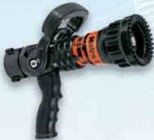
ME1-VPGI : Nozzle Metro 1, dengan Sliding Valve & Pistol Grip