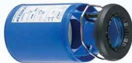
Model FJ-MX-HM Multi-Expansion Foam Attachment