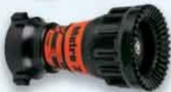
ME2-2TO : Nozzle Metro 2 Tip only, tanpa Sliding Valve & Pistol Grip