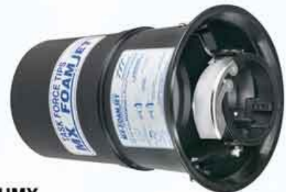
Model FJ-HMX Multi-Expansion Foam Attachment Material : Polyethylene, Stainless Steel, Aluminium