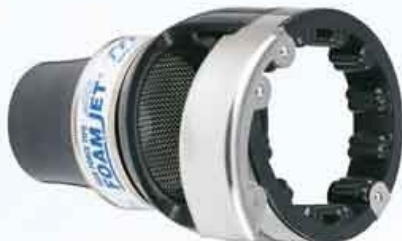
Model FJ-H Low-Expansion Foam Attachment Material : Molded Rubber, Stainless Steel, Aluminium

Metro 2 bisa dipasangkan "air-aspirating attachment" untuk membuat foam. Ringan dan kuat, dan dengan mudah dan cepat dapat dipasangkan pada Nozzle Metro 2.