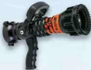
ME2-2VPGI : Nozzle Metro 2, dengan Sliding Valve & Pistol Grip